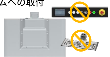
(拡張不可、吊り下げ式)