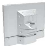
(拡張可能、ポール式)